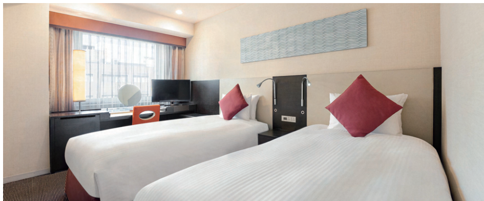
ツインルーム (19 m 2 )