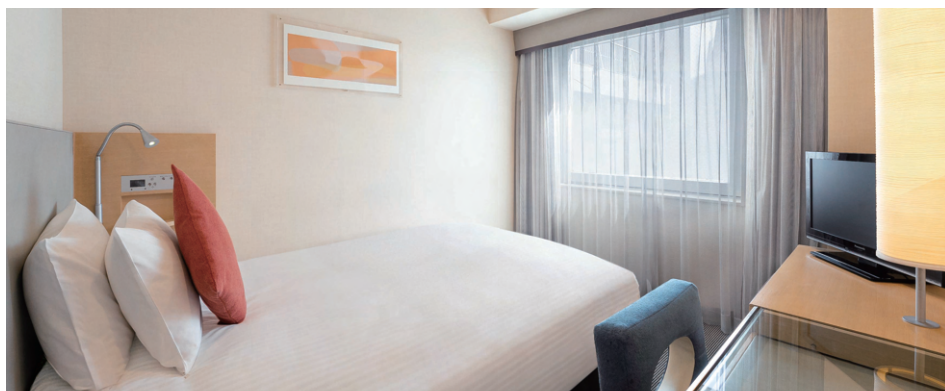
シングルルーム (17~20 m 2 )